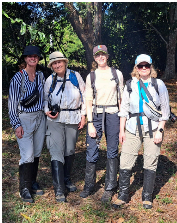
Íslenski hópurinn í vettvangsferð í Brasilíu