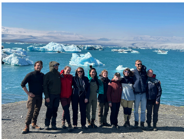
ARCADE hópurinn á Grænlandi