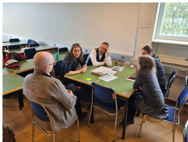
Svipmyndir frá vinnustofu í maí