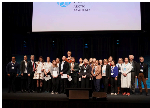
ARCADE hópurinn útskrifast á Arctic Circle