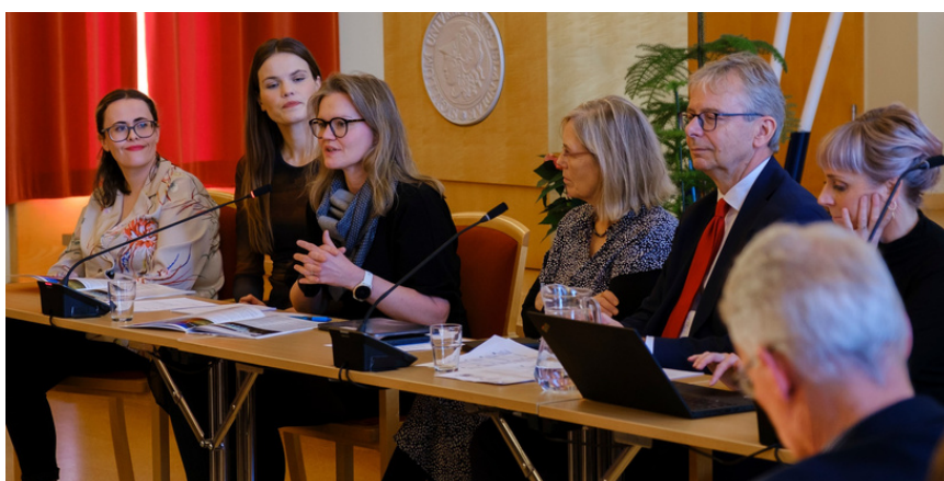
Sjálfbærnisráð HÍ var kynnt á háskólaþingi