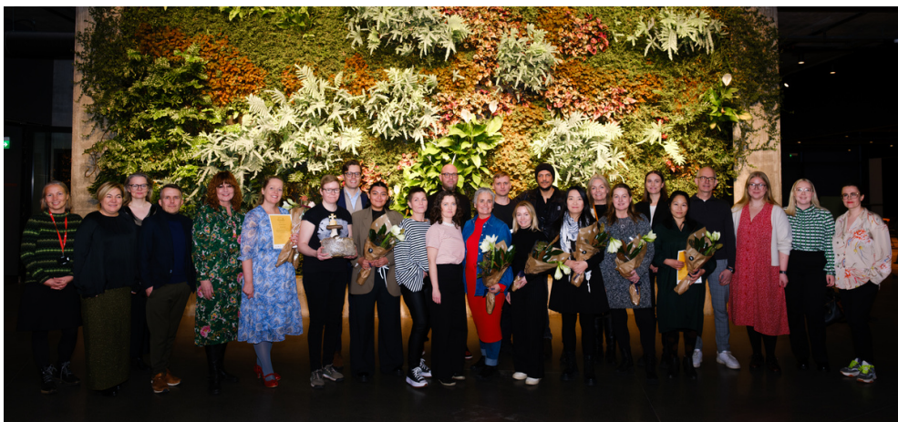
Teymin og aðstandendur Snjallræðis fögnuðu á lokaviðburði í desember

Snjallræði er 16 vikna vaxtarrými (e. incubator) sem styður við öflug teymi sem brenna fyrir lausnum á áskorunum samtímans og styðja við heimsmarkmið Sameinuðu þjóðanna. Það geta verið lausnir sem snúa að heilbrigðisþjónustu, velferðartækni, bættu menntakerfi og jafnréttismálum, svo dæmi séu tekin. Snjallræði var stofnað af Höfða friðarsetri árið 2018 og kemur Sjálfbærnistofnun að utanumhaldi vaxtarrýmisins.