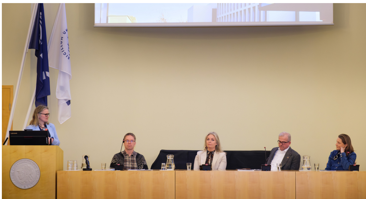
Hátíðinni lauk með pallborðsumræðum um sjálfbærni