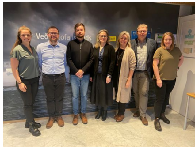
Stjórn samráðsvettvangs um þekkingarsköpun vegna áhrifa loftslagsbreytinga

Sjálfbærnistofnun átti sæti í stjórn samráðsvettvangs um þekkingarsköpun vegna áhrifa loftslagsbreytinga. Samráðsvettvangurinn skal þjóna sem rými fyrir fundi, vinnustofur og fræðslu vegna rannsókna og greininga á áhrifum loftslagsbreytinga og starfar í umboði umhverfis-, orku- og loftslagsráðherra. Í stjórn vettvangsins sitja fulltrúar frá Veðurstofu Íslands, Samstarfsnefnd háskólastigsins, Sjálfbærnistofnun HÍ, Hafrannsóknastofnun, Náttúrufræðistofnun Íslands, Umhverfisstofnun og Embætti landlæknis.